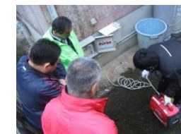
LPガス発電機の設置(桜井市八井内地区)