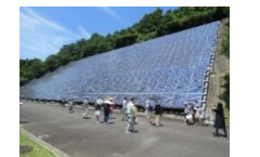
バスツアー(御所浄水場)