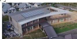
太陽光・蓄電池の設置(野迫川村中学校)