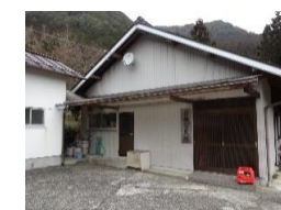
LPガス発電機の設置(十津川村谷瀬)