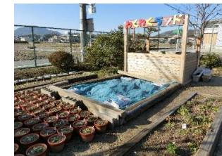
落ち葉や枯れ木を堆肥化し、校内の花作りに利用。ゴミを処分する際に必要なエネルギーの削減。