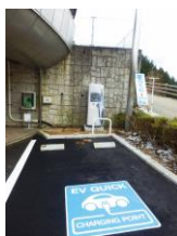
急速充電器の設置(道の駅大塔)