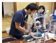
アドバイザー派遣(山添村)